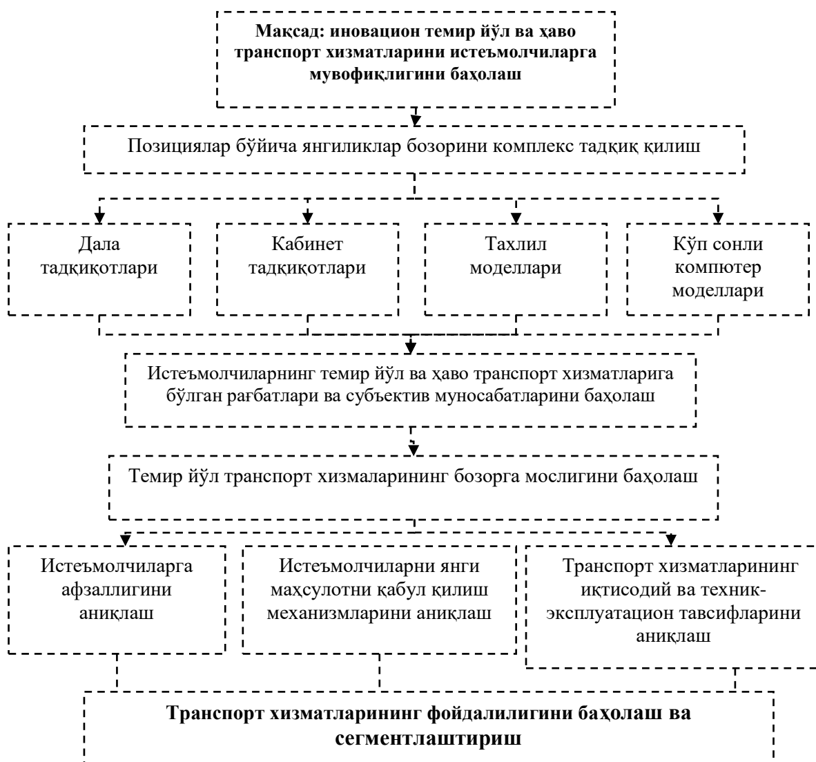
1-расм. Темир йўл ва ҳаво транспорти рақобатбардошлигини баҳолаш кетма-кетлиги 1

Юқоридаги фикрларни инобатга олиб транспорти хизматларини иқтисодий самарадорлигини баҳолаш кетма-кетлигини баҳоланишнинг умумий кўринишини қуйидагича тасвирланди. Фикримизча, темир йўл ва ҳаво транспорт хизматларини иқтисодий самарадорлигини баҳолаш орқали корхонани келгусида ривожлантиришни таъминлаш учун инновацион технологияларидан фойдаланиш йўллари аниқлаш имкониятини беради. (1-расм).