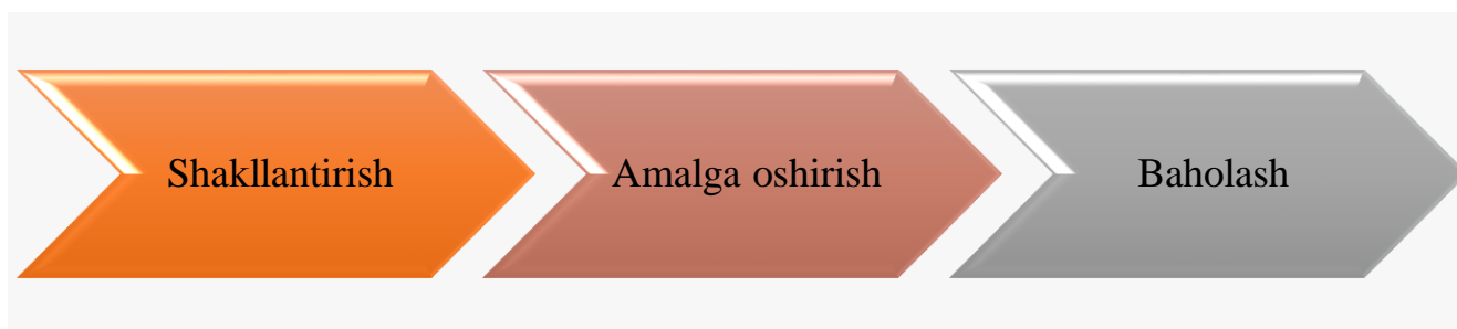
2-rasm. Boshqaruv hisobi jarayoni 29

Boshqaruv jarayonini biz quyidagi 2-rasmda ko'rib o'tamiz.