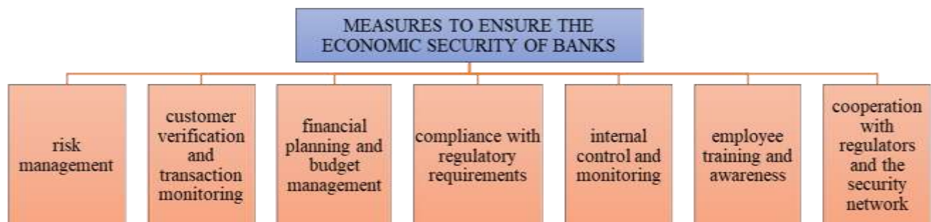
Fig.1. Measures to ensure the economic security of banks

In turn, it should be noted that measures to ensure the economic security of banks play an important role in preventing and reducing risks and threats. Below, in the form of a diagram, we will consider an overview of the main measures that banks can take: