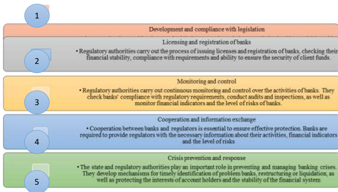
Fig.2. Functions of the state and regulatory authorities

The state and regulatory authorities play an important role in ensuring the economic security of banks. They perform the following functions, which we will consider below: