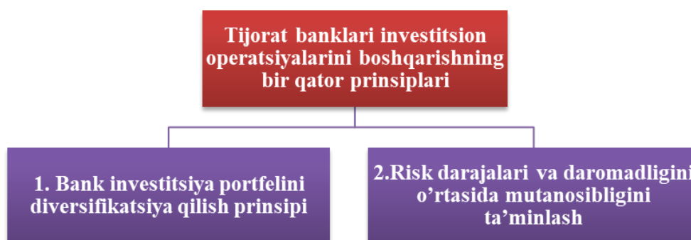
1-rasm. Tijorat banklari investitsion operatsiyalarini boshqarishning prinsiplari

Investitsiya faoliyatini tashkil etish va amalga oshirish, birinchidan, cheklangan resurslardan samarali foydalangan holda investitsiyalar dinamikasini ta'minlash, ikkinchidan, pul mablag'lari tarkibi va soliq imtiyozlaridan unumli foydalanish hisobiga risk va xarajatlarni kamaytirishga asoslanishi lozim. Bu tamoyilning samarali ishlashini ta'minlash davlat tomonidan investitsiya faoliyatini amalga oshirish va rivojlantirish uchun qulay tizim tashkil etishni talab etadi. Bundan kelib chiqib tijorat banklari investitsion operatsiyalarini boshqarishning bir qator prinsiplari mavjud (1-rasm).