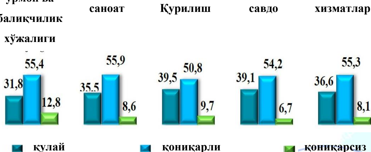
2-расм. 2021 йилнинг IV чорагида кузатувда иштирок этган кичик корхона ва микрофирмаларнинг жорий даврда иқтисодий вазиятини баҳолаш, % да 48

Шунингдек, иқтисодий вазиятни қониқарли деб баҳолаган корхоналарнинг энг кўп улуши саноатда – 55,9 % ни, қишлоқ, ўрмон ва балиқчилик хўжалигида – 55,4 % ни, хизматлар соҳасида – 55,3 % ни ташкил этди.