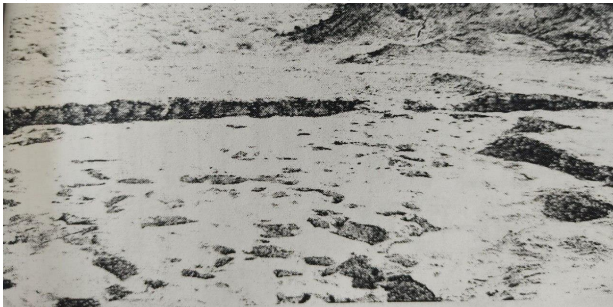
1-rasm. Quyi Zarafshon Uchashi 31 manzilgohi

Sug'orma sharqning barcha mayda, o'rtamiyona va katta hajmli maqomiga ega bo'lgan daryolar havzasi singari O'rta Osiyo yirik daryolari Amudaryo va Zarafshon daryolari asrlardan asrlar mobaynida qadimgi dehqonchilik madaniyati vujudga kelishiga omil bo'lgan sug'orish tarmoqlari, suv inshootlari barpo qilinishi hamda sug'orma xo'jalikning rivojlanishiga imkon yaratgan. O'rta Osiyo tarkibiy qismi bo'lgan Xorazm vohasi hamda Quyi Zarafshon vodiylariga odamzodning kelib joylashib, ko'p tarmoqli xo'jalik sohalarining rivojlanishida aholining farovon hayot va noyob ixtirolarini kashf etishiga imkon yaratgan.