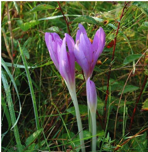
Colchicum autumnale гули

ҳосил қилади. Чангчиси одатда 6 тадан, уруғчиси 3 та мевачабаргдан ташкил топган. Меваси кўп 50 баргакли кўсакча. Colchicum autumnale , одатда кузги заъфарон, ўтлоқ заъфарони,[2] ёки яланғоч хоним сифатида танилган, ҳақиқий заъфаронга ўхшаб кетадиган заҳарли кузда гуллайдиган ўсимлик. Лекин ҳақиқий заъфарондан фарқли ўлароқ бу ўсимлик Colchicaceae ўсимлик оиласига киради. “Яланғоч хонимлар” номи барглардан аввал гуллар пайда бўлгани сабабли берилган[3]. “Ўтлоқ заъфарони”, “кузги заъфарон” уммумий номларига қарамай, бу ўсимлик заъфаронга алоқадор эмас.